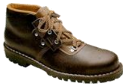
Scarpe di sicurezza con puntale di protezione