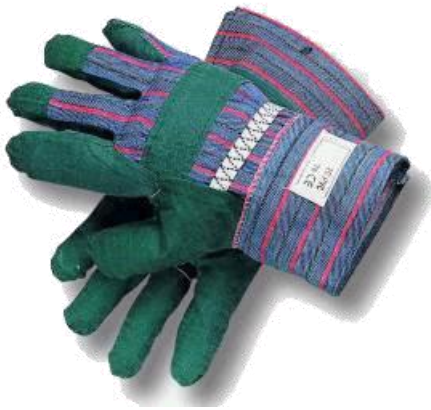
Guanti di uso generale per la movimentazione manuale dei carichi